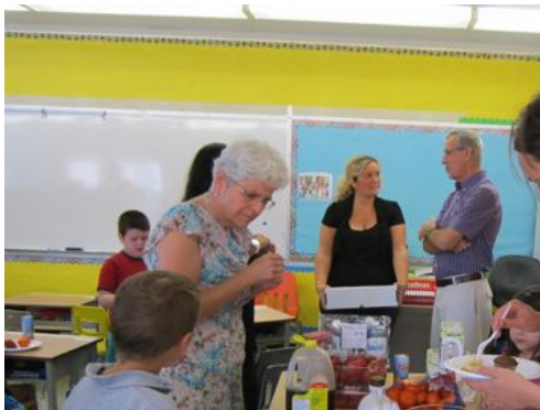
Petit déjeuner communautaire de la rentrée

L'hiver est à notre porte, les vacances de Noël arrivent à grands pas, il est temps de célébrer tout le travail accompli depuis la rentrée :-)